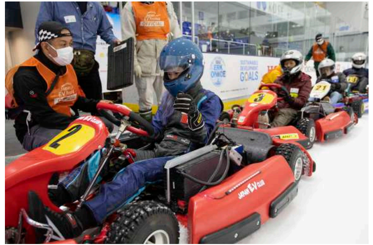
氷上電気カート競技会)